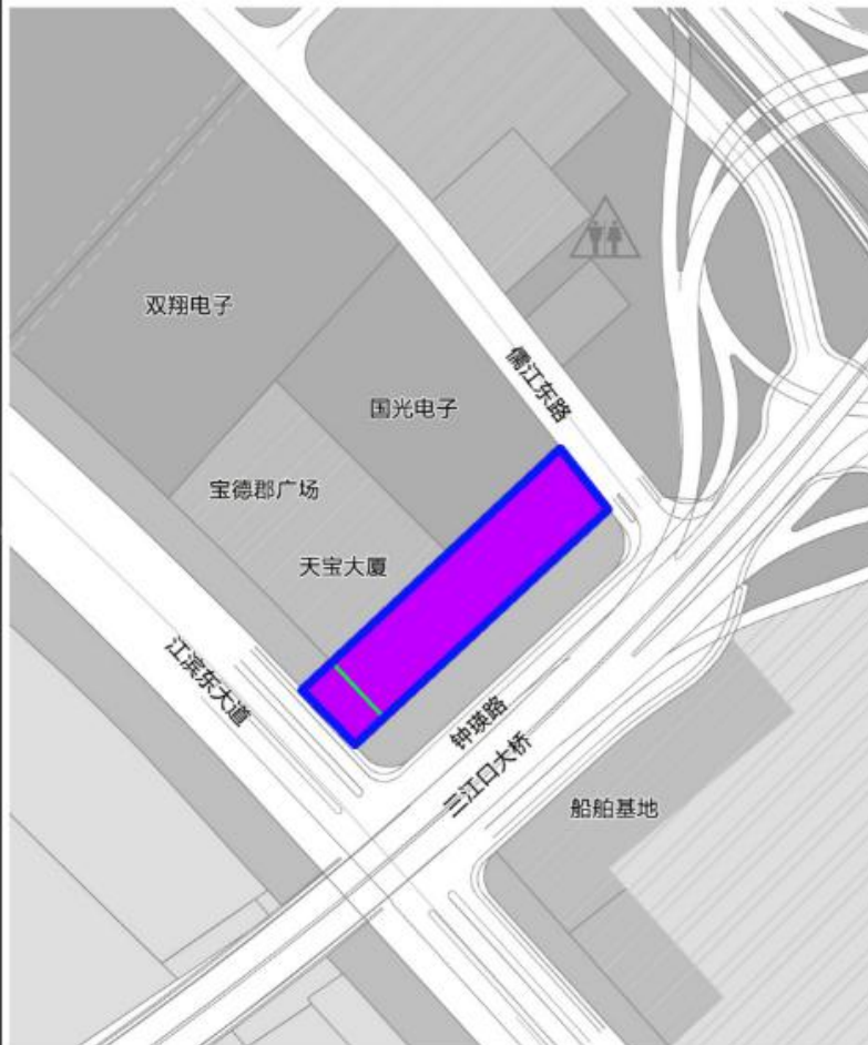
地块控规草案示意图